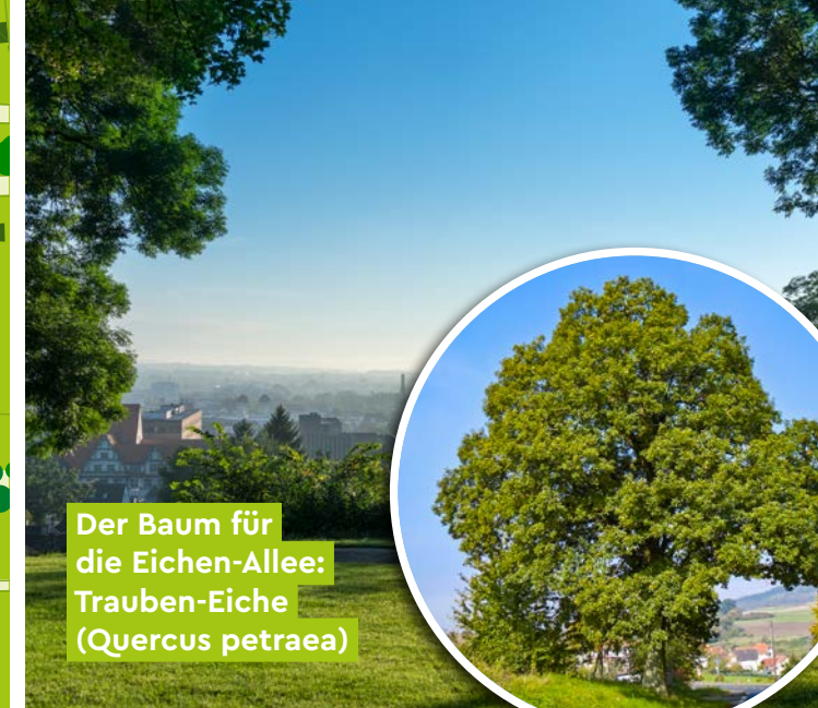
Der Baum für die Eichen-Allee: Trauben-Eiche (Quercus petraea)