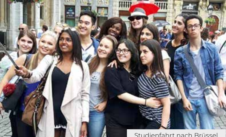
Studienfahrt nach Brüssel