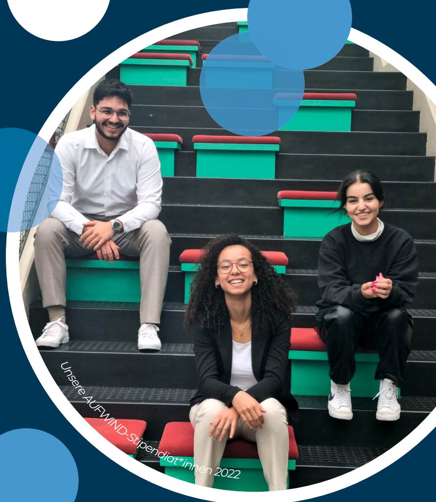
Unsere AUFWIND-Stipendiat*innen 2022